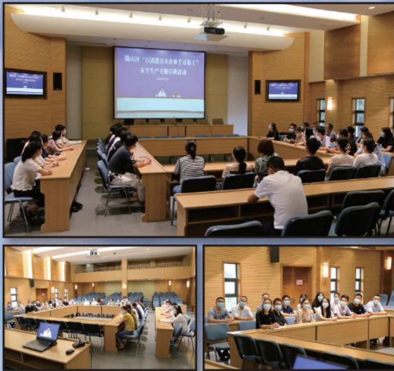
7. 21 锡山区安全生产专题宣讲