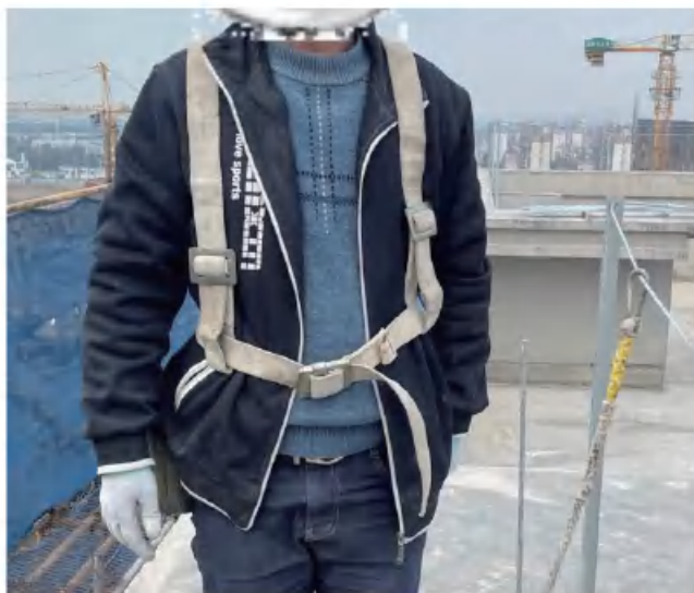
(工人现场安全施工图片)

从图片中我们能看到所谓的安全加固就是拿4#角钢用膨胀螺丝固定在主体上做固定撑杆，上顶部打孔后将Φ10的钢丝绳穿过，形成一个拥有固定能力的区域。如图中展示，工人在屋面施工的安全性大大提高，也让项目部放心。而且屋面作业完成后，国标角钢还能拆下用于工地其他作