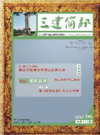
2012 年 6 月 第 113 期