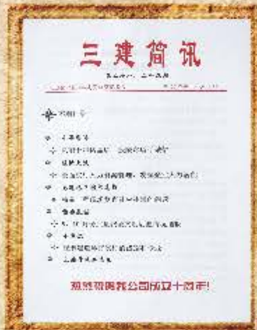
2004 年 11 月 第 28、29 期