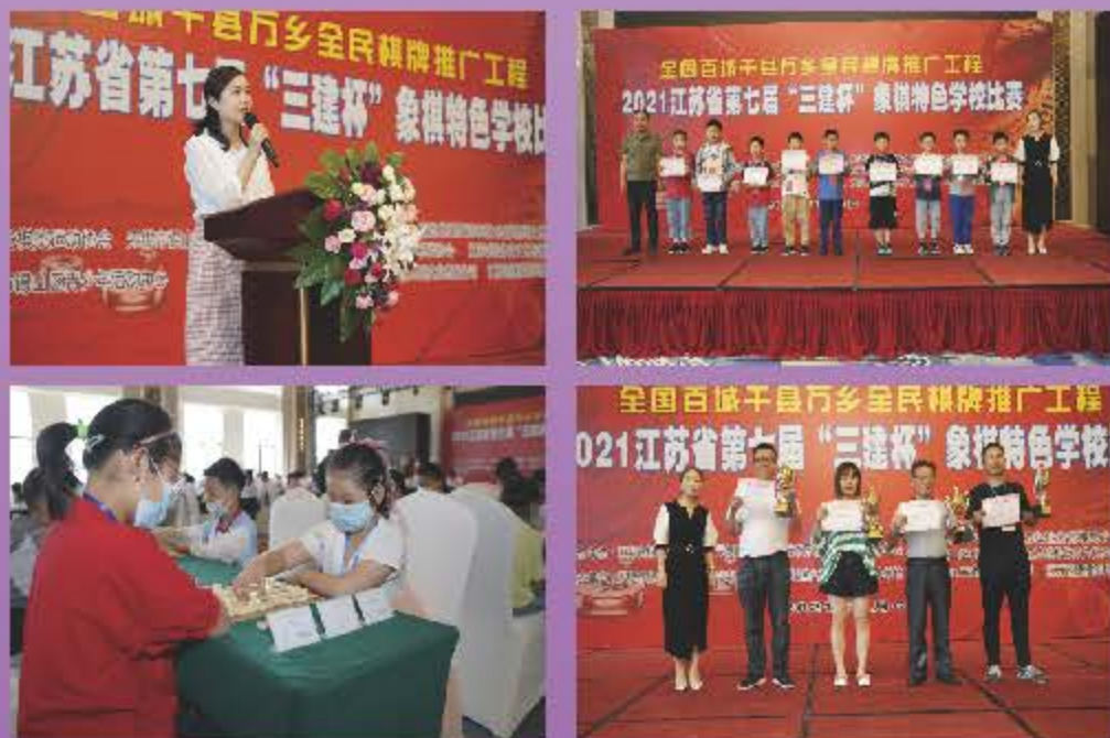
江苏省第七届“三建杯”象棋比赛