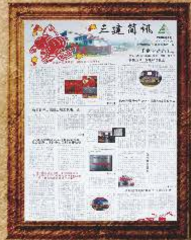
2006 年 1 月 第 39、40 期