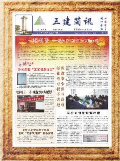
2011 年 4 月 第 100 期