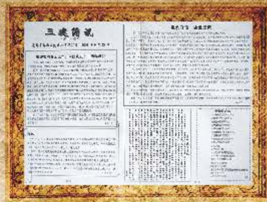
2001 年 9 月 第 11 期