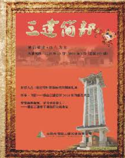
2021 年 1 月 第 197 期