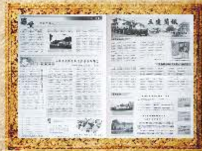
2005 年 8 月 第 35 期