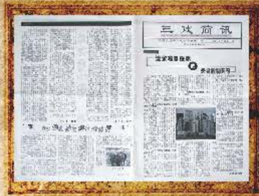
2004 年 4 月 第 24 期