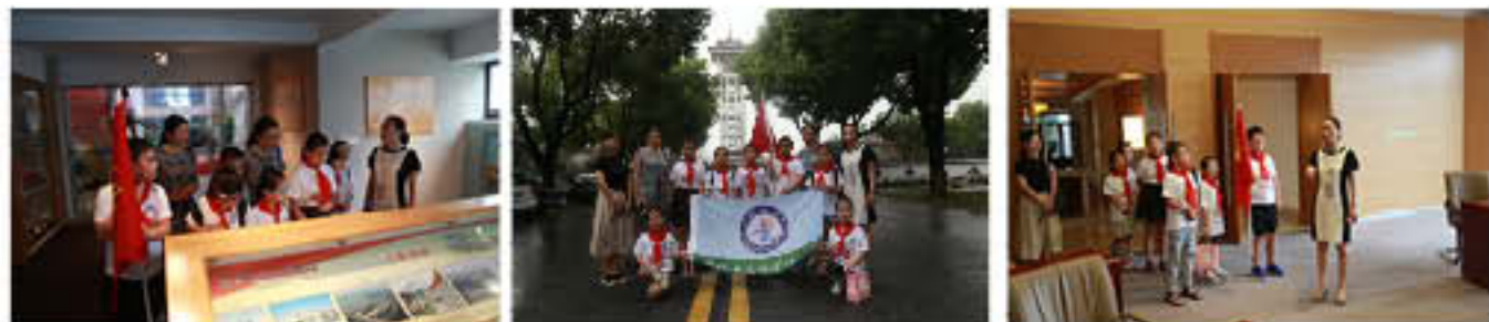
图为张泾实小学生参观改革开放40周年锡北镇代表企业