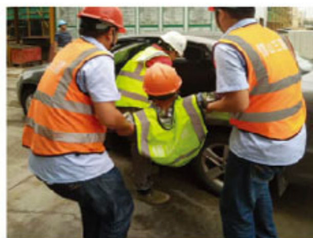
转移过程中避免二次伤害