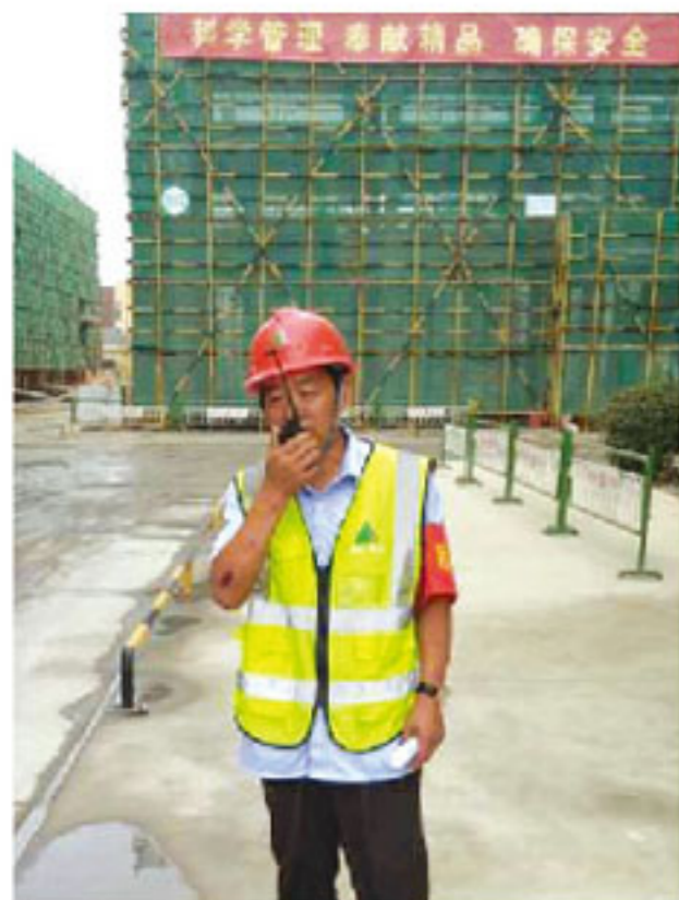
演练长收到事故报告