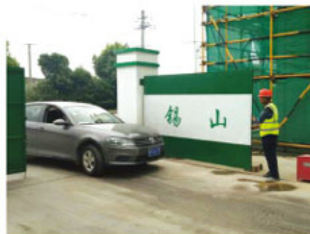
救护车辆进入现场