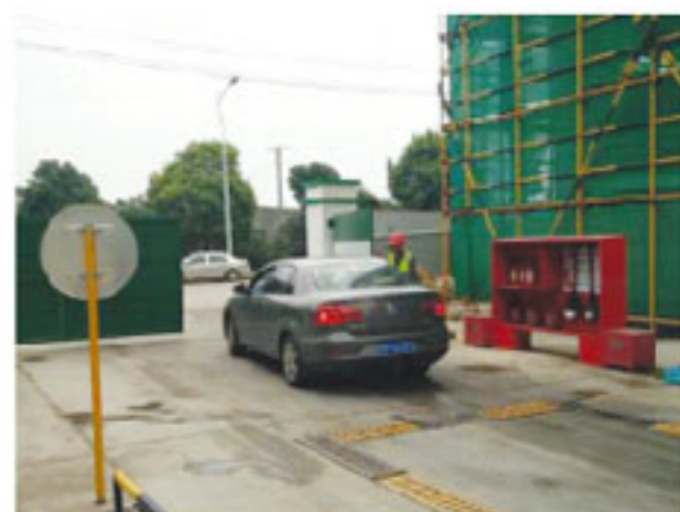
伤员送往附近医院