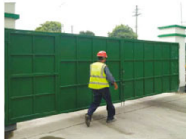
封锁事故现场等待救援