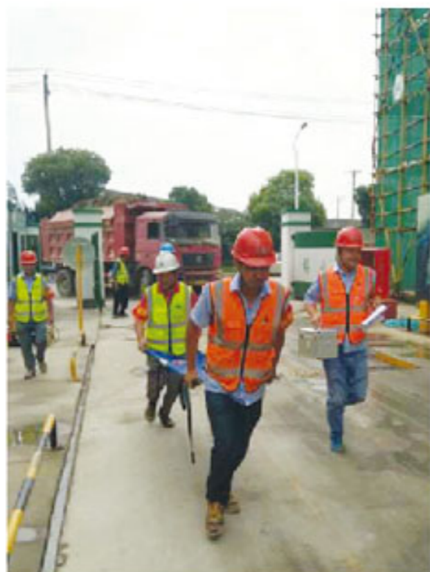
急救、救援、后勤各小组奔赴现场