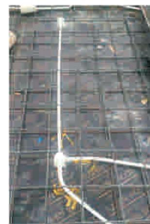
图三、楼层预埋配管导管整齐