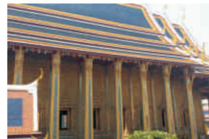
到处金光闪闪，恨不得上去抠一块带回的大皇宫。

泰国，是庙宇林立的千佛之国，是信仰为上的微笑之国，还有“黄袍佛国”的美名。曼谷，是全国政治、经济、文化中心和现代与传统相交融的大都市，是金碧辉煌的大王宫、镶嵌金玉的玉佛寺、庄严肃穆的金佛寺、四面佛等名胜的所在地。芭提雅，素以阳光、沙滩、海鲜名扬世界，美丽的海景、最负盛名的人妖表演、缤纷无休的夜文化。这些，无一不吸引着全世界的游客去泰国一睹真容。