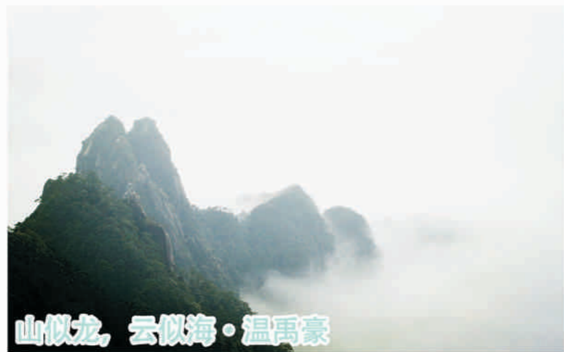
山似龙, 云似海 · 温禹豪