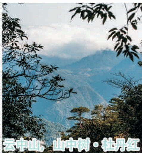
云中山, 山中树 · 牡丹红