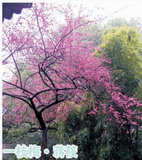
一枝梅 · 蒋筱