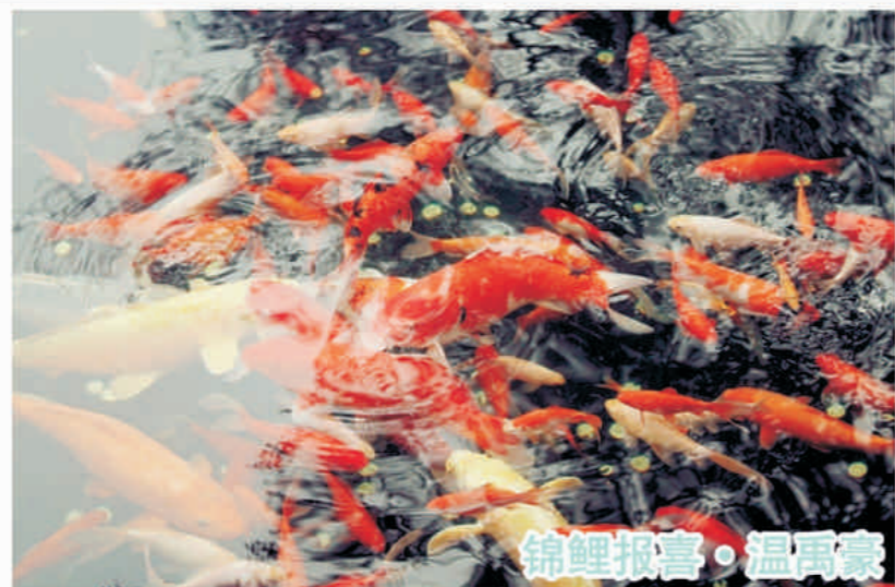
锦鲤报喜 · 温禹豪