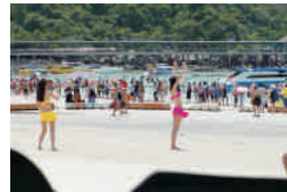
芭提雅的金沙岛，蓝天、白云、碧海、阳光、海鲜、快艇、比基尼。

在曼谷，我享受了一把泰式按摩；在芭提雅，我享受了一下泰式SPA。要说按摩和SPA有啥区别，用全陪美女导游的话说：“按摩是接地气，SPA是高大上。”不错，既然来了，我不光要接地气，当然也要来把高大上啊。出门旅游，是为了放松自己，做按摩是最能放松的时刻，做SPA更是从内到外的舒爽啊。