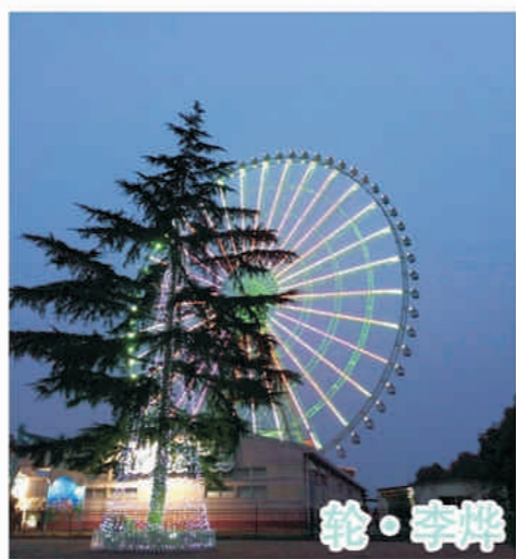
轮 · 李焯