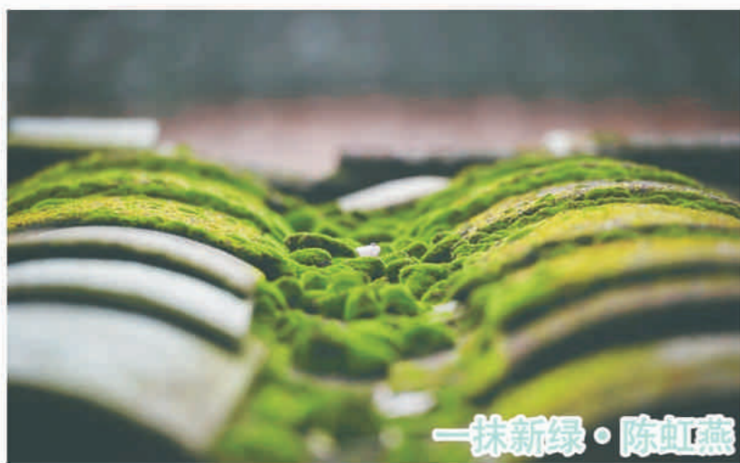
一抹新绿 · 陈虹燕