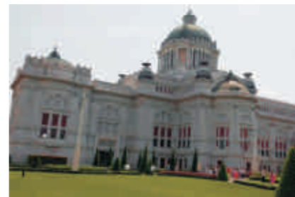
外表朴实，内在奢华无比、光芒璀璨的国会大厦。