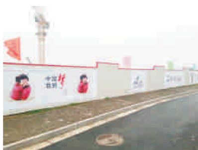
文明创建挂图张贴