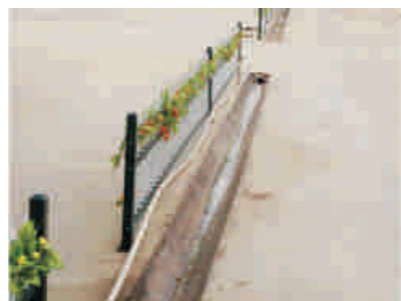
办公区与施工道路隔离

无锡市锡山实验小学（简称：锡山实小）位于无锡市锡东新城高铁商务区窗口地段，该工程是公司承建锡东高级中学后的又一配套公共建筑。总建筑面积31265平方米，结构形式为框架结构，工程规模60个班，于2013年10月18日正式开工。