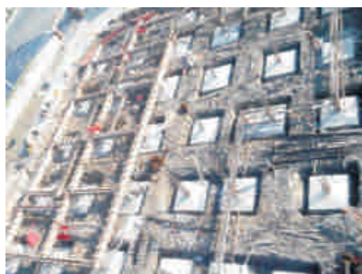
基础建设中的锡山实小