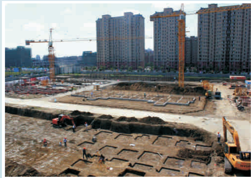
俯瞰建设中的鸿景雅园