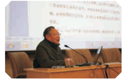
◆ 关于工程技术人员成长的思考

2月21日-23日，公司在报告厅举行为期三天的冬季培训。培训内容主要有“宏观经济形势”、“实用哲学”、“消防与自救”、“新交规解读”、“施工技术”、“质量通病防治”以及“关于技术人员成长的思考”，参加人员涉及到了全体干部、党员、骨干、技术人员和其他相关人员近140人左右。