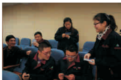
发放江苏省交巡警温馨提示卡