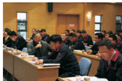
公司内部QC发布现场