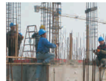
复工后的廊下花苑安置房工地