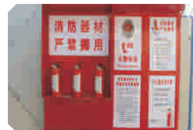
安全消防设施设置齐全