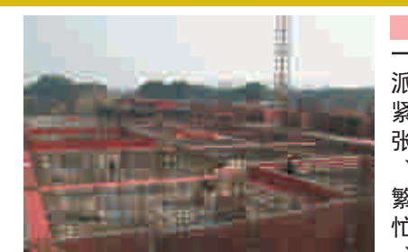
有序的景象 一派紧张、繁忙、

廊下花苑安置房总建筑面积11.1万平方米，由10栋18层组成。自开工六个月来，项目建设正有序推进。虽然现在已经到了腊月，但施工现场仍然是一派繁忙景象，所有人员都忙的如火如荼，为的就是在过年前能够完成地下室结构的施工。在现场我们可以看到，钢筋工正在对地下车库的顶板进行绑扎，寒风凛冽中，一个个黝黑的脸庞，用一双双长满厚实茧的手，一把弯钩型带把的工具，利用手腕的柔劲，把一