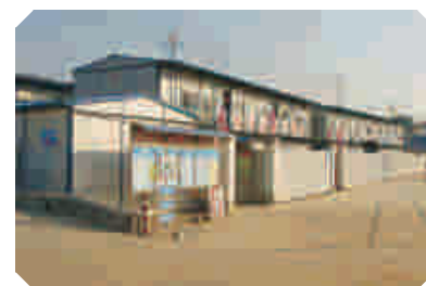
现场路面干净整洁