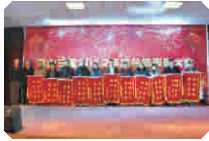
◆ 颁发优秀材料供方奖