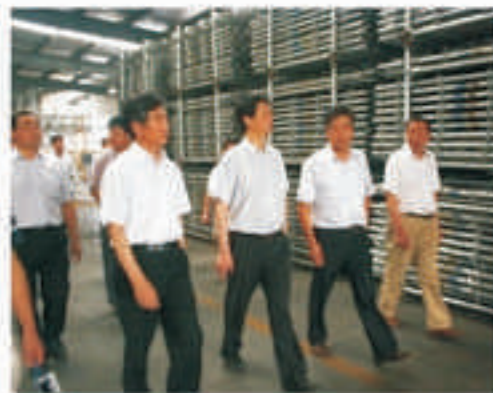
速捷脚手架成品车间