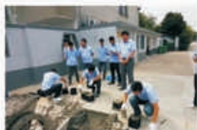
■ 砼试块制作及经纬仪使用