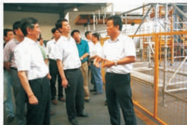
参观速捷脚手架生产车间